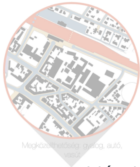
Megközelíthetőség: gyalog, autó, vasút